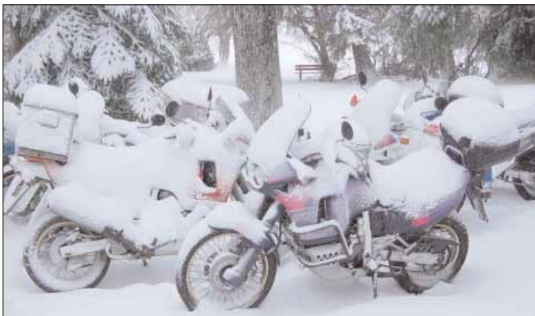
Dieser Anblick bot sich den «Holzern» am Sonntagmorgen...

Lanzendörfer Geschäft für Outdoor und Trekking Zubehör Online-Shop